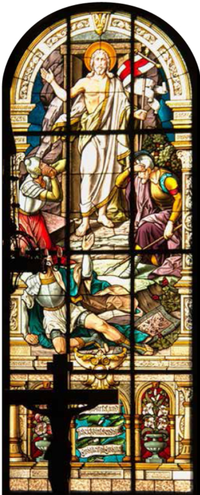
Auferstehungsfenster Johanniskirche Albernau