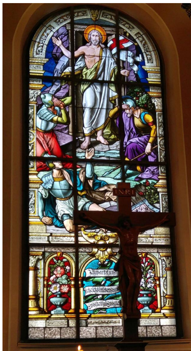
Osterfenster der St. Johanniskirche Albernau