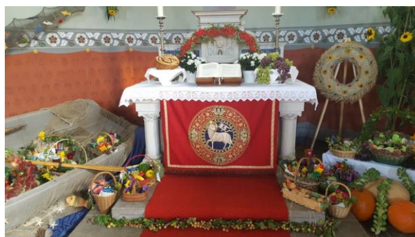
Geschmückter Altar zu Erntedank in Albernau im Jahr 2016

Treffpunkt montags 19.30 Uhr Junge Gemeinde dienstags 19.00 Uhr Gebetseinkehr mittwochs 9.00 Uhr Kirchenchor mittwochs 19.30 Uhr Bibelkreis donnerstags 19.00 Uhr Posaunenchor donnerstags 19.30 Uhr Kurrende I freitags 15.30 Uhr Kurrende II freitags 16.30 Uhr